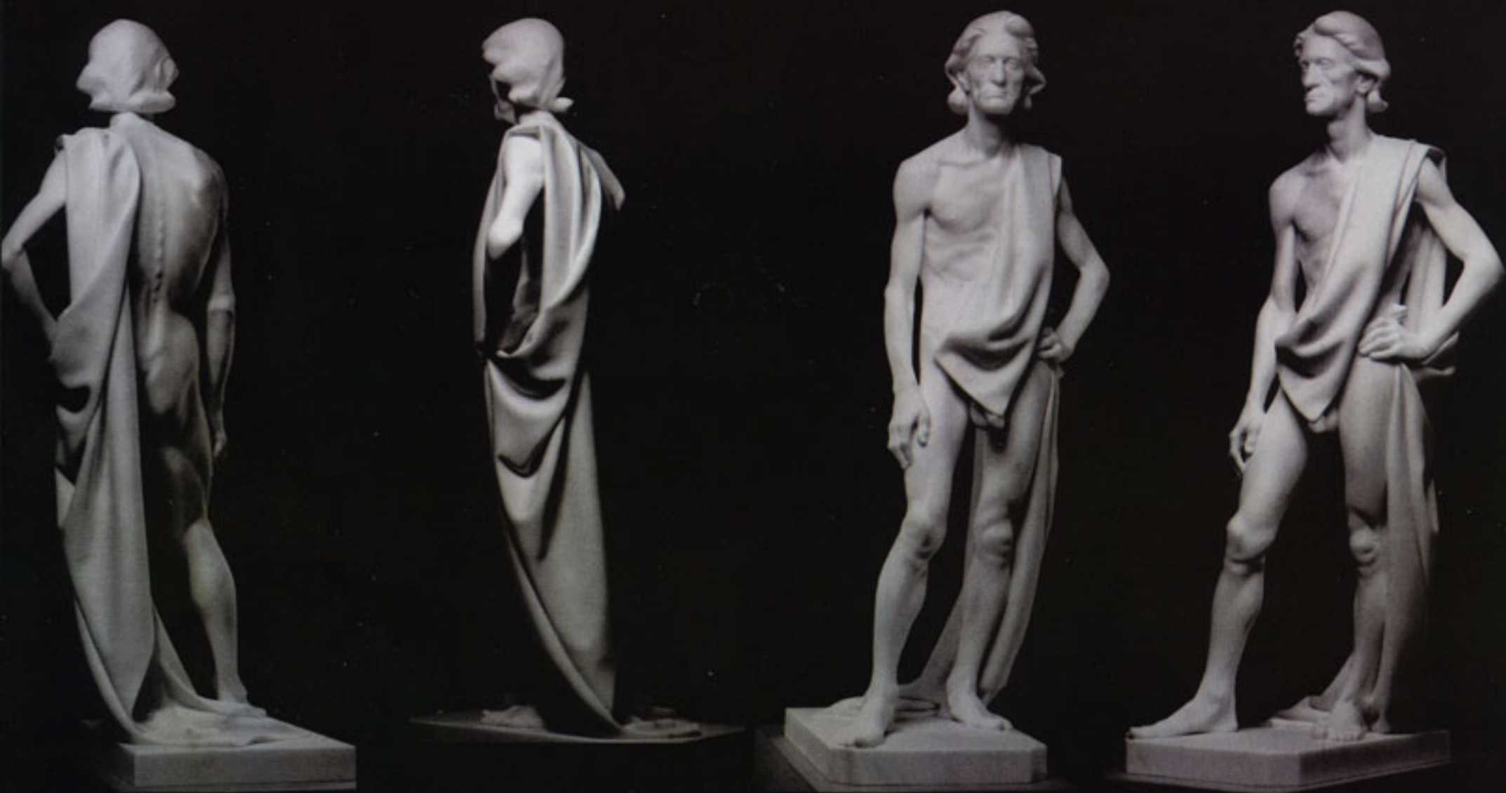
施洗圣约翰2001，卡拉拉大理石145cm