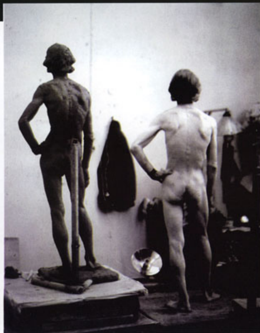
施洗圣约翰的模特2001，粘土125×43×40厘米